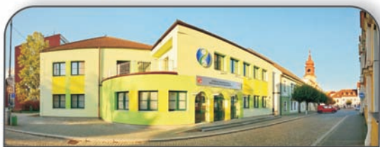
Fakultní škola Univerzity Karlovy Přírodovědecké fakulty

Informace na tel.: 381 500 512 (ředitel), 381 500 514, 381 500 511, e-mail: info@sos-veseli.cz, http://www.sos-veseli.cz.